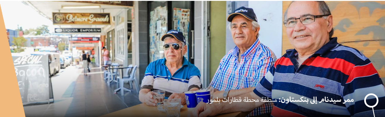
ممر سيدنام إلى بنسكتاون: منطقة محطة قطارات بلمور