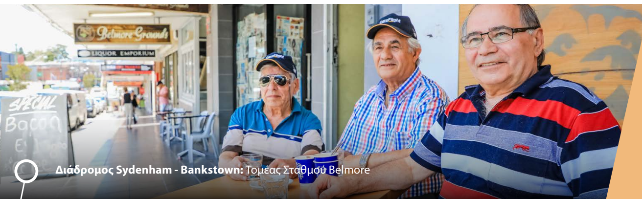
Διάδρομος Sydenham - Bankstown: Τομέας Στάθμου Belmore

Ο τομέας του σταθμού Belmore επισημάνθηκε ως Τομέας Προτεραιότητας. Το υπουργείο DP & E θα συνεργαστεί με το Δημοτικό Συμβούλιο για να προσδιορίσει τις περιοχές στον τομέα στις οποίες θα δοθεί προτεραιότητα για ανακατάταξη οικοδομικής ζώνης.