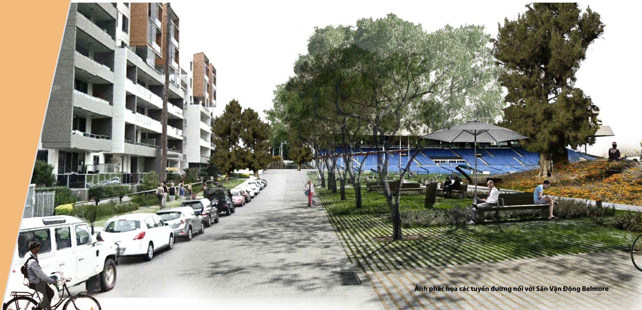
Ảnh phác họa các tuyến đường nối với Sân Vận Động Belmore