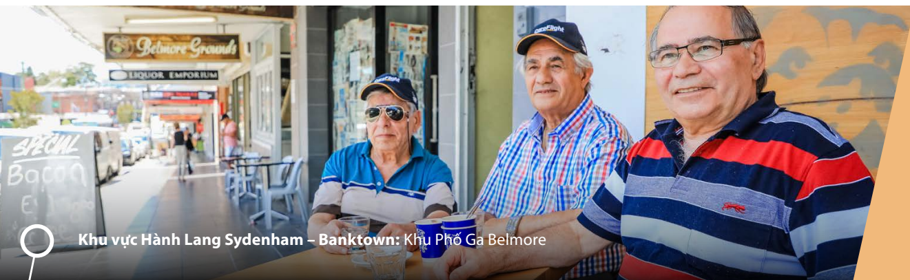
Khu vực Hành Lang Sydenham – Banktown: Khu Phố Ga Belmore