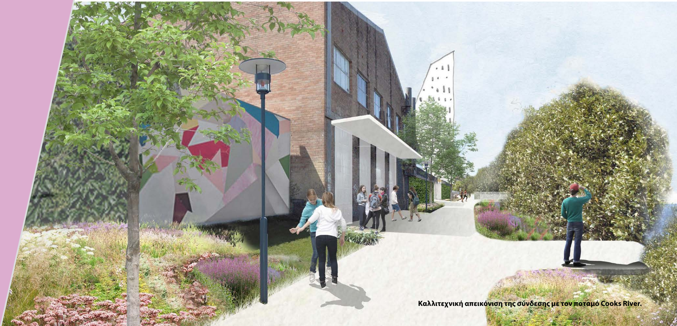
Καλλιτεχνική απεικόνιση της σύνδεσης με τον ποταμό Cooks River.