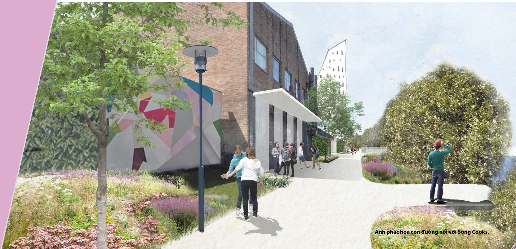
Ảnh phác họa con đường nối với Sông Cooks.