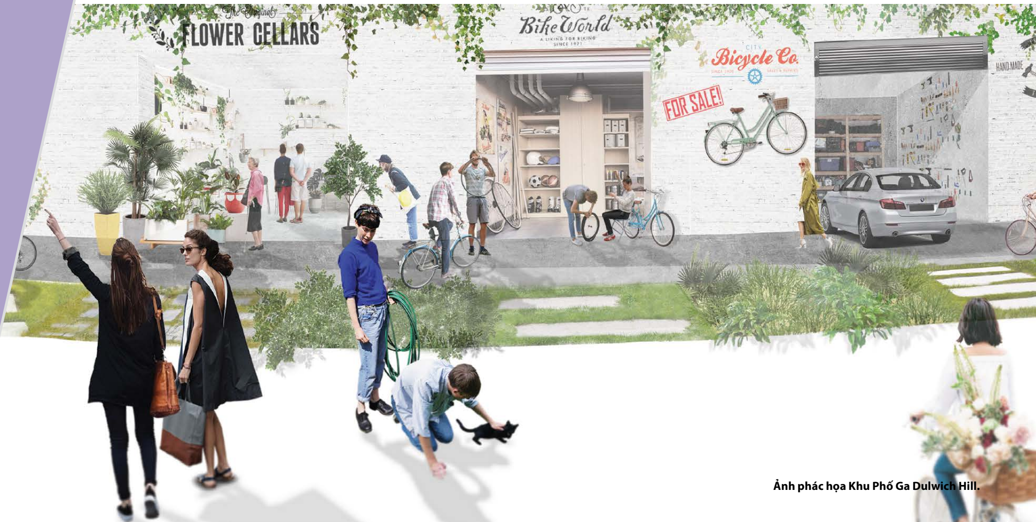
Ảnh phác họa Khu Phố Ga Dulwich Hill.