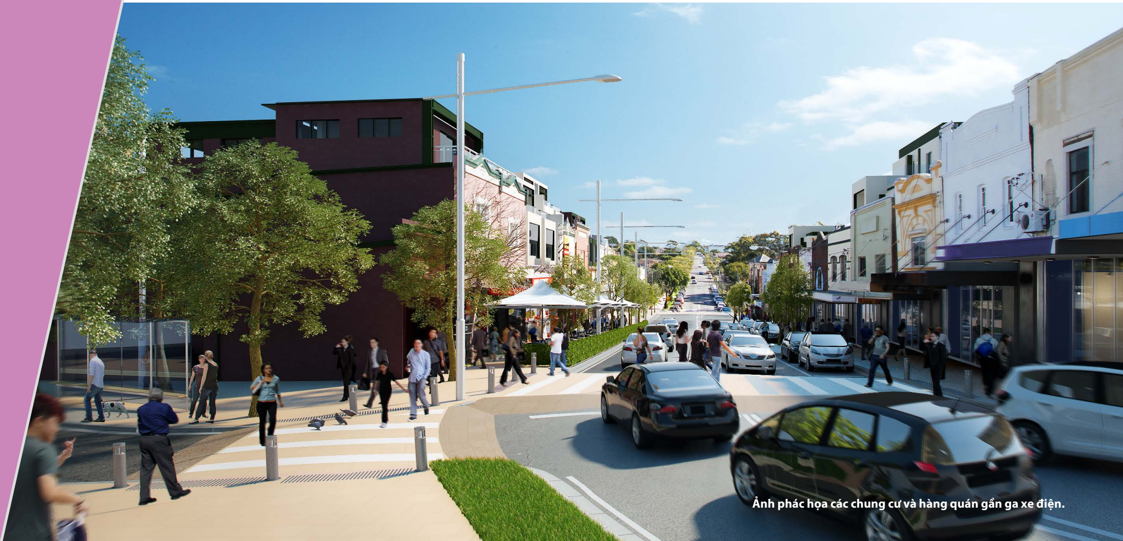
Ảnh phác họa các chung cư và hàng quán gần ga xe điện.