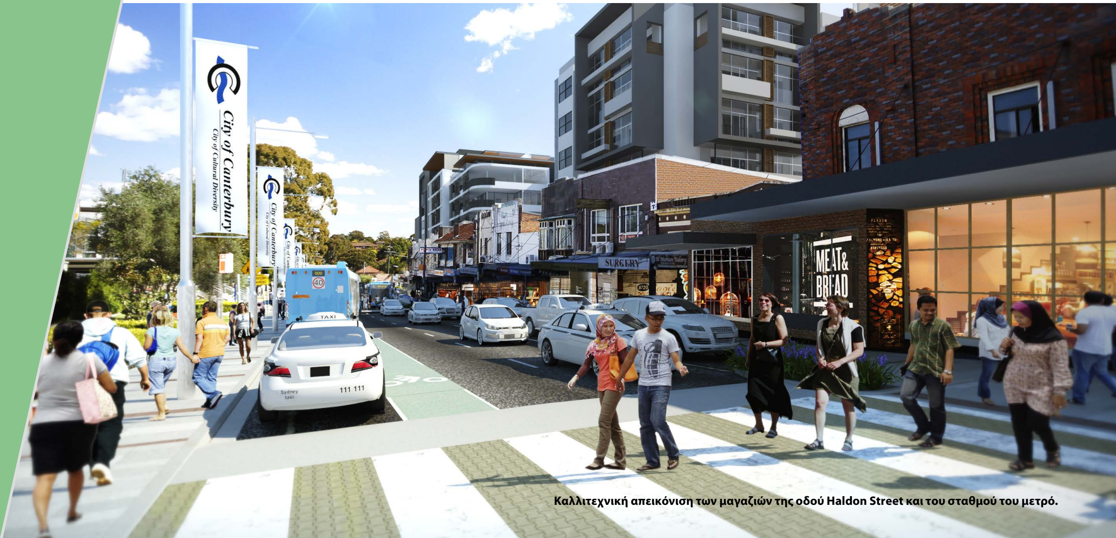
Καλλιτεχνική απεικόνιση των μαγαζιών της οδού Haldon Street και του σταθμού του μετρό.