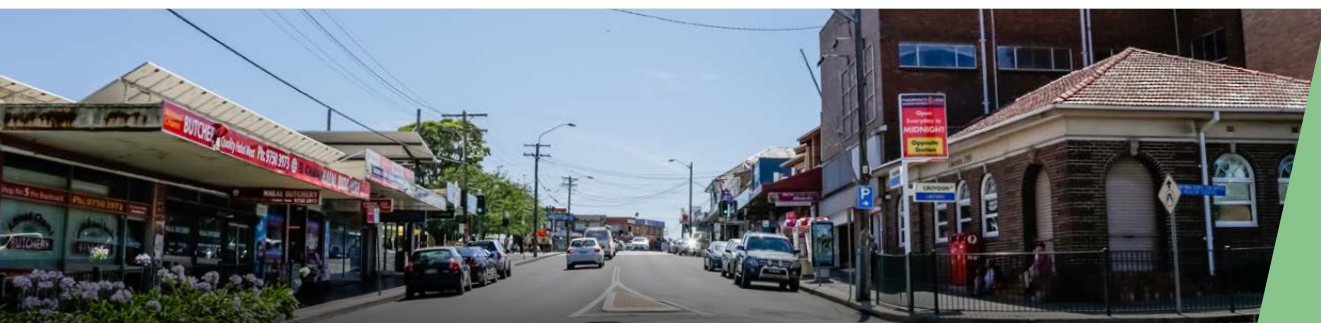
Khu Hành Lang Sydenham - Bankstown: Khu Phố Ga Lakemba