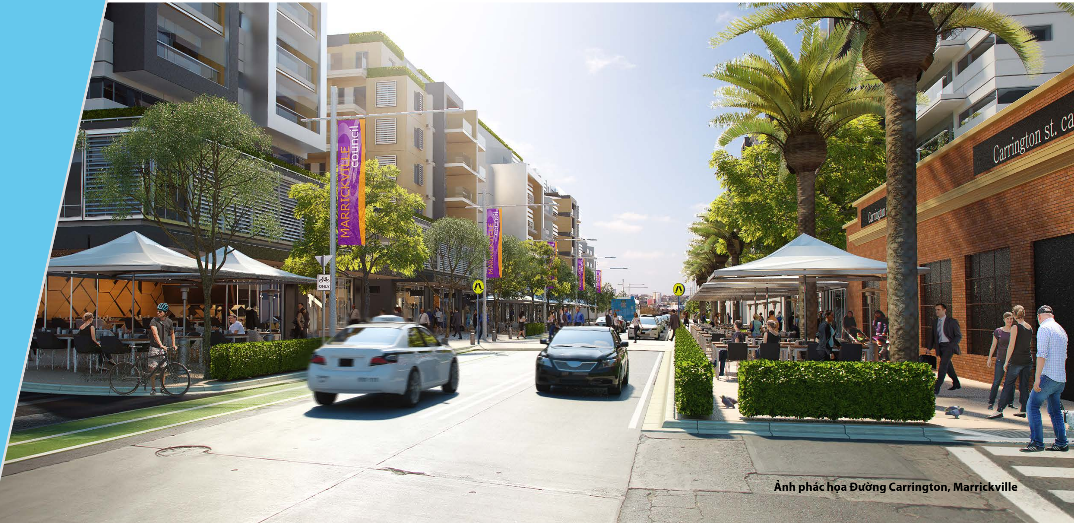
Ảnh phác họa Đường Carrington, Marrickville