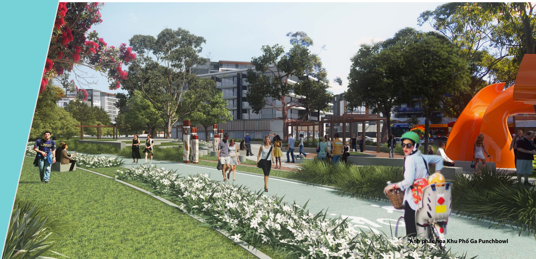
Ảnh phác họa Khu Phố Ga Punchbowl