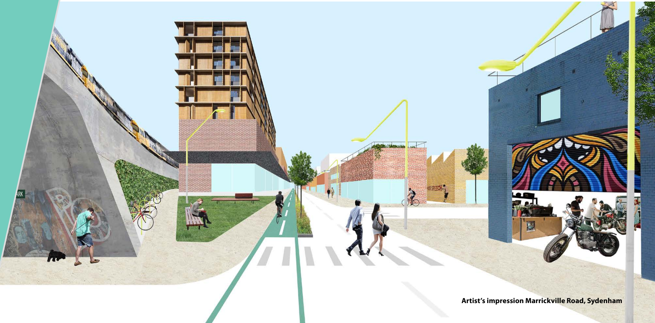
Artist's impression Marrickville Road, Sydenham